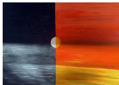
MER REFLET DE L'AME