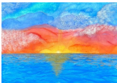
LES COULEURS DE LA MER AU LEVER DU SOLEIL