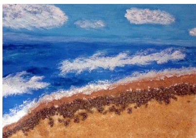
L'HORIZON EST NOTRE FRONTIERE